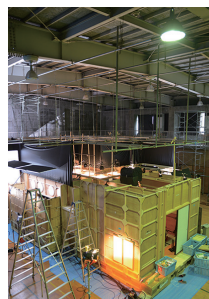
小山フィルムファクトリー 体育館（スタジオ）