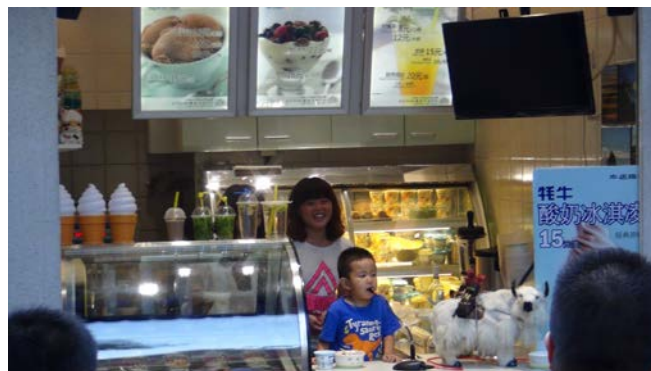
鼓樓東大街、あるお店の客引きアナウンスがすごかった