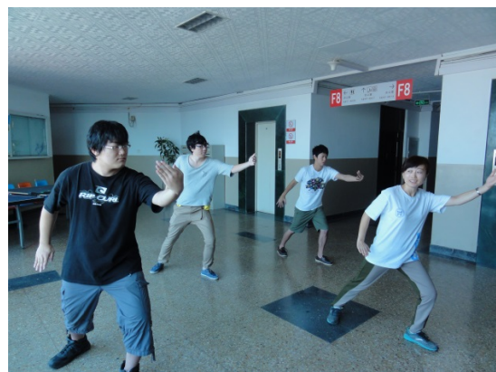
先生の動作を見ながらの太極拳

慣れてきた頃に、実際に剣を使ったものもお見せいただき、その一部の動作を実際に剣を持って行いました。柄は片手分ほどの剣ですが、刀身は1mほどあるものを使わせていただき、一同テンション上がりながらの体験となりました。