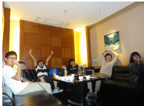
こんな感じでのカラオケでした