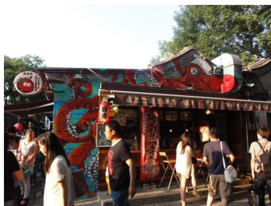
人が多く雰囲気は商店街を大きくした感じ