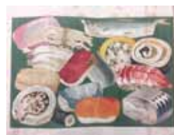
小泉清三郎 (汪外) 著「家庭昼のつけかた」 大倉書店、明43.7(請求記号 246-213)