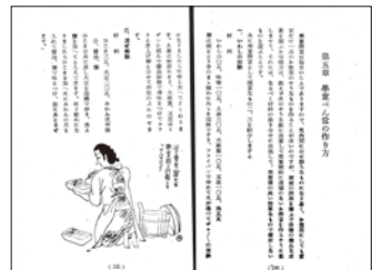
神奈川県食糧営団 編「決戦食生活工夫集」産業経済新聞社、昭和19(請求記号 596-Ka43ウ) ※戦時中の弁当のレシピ。