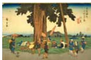
広重 画「木曾海道六拾九次之内伏見」 (請求記号 寄別2-2-1-5) ※弁当を食べている場面。

詳細は https://www.ndl.go.jp/jp/kansai/events/index.html に掲載予定