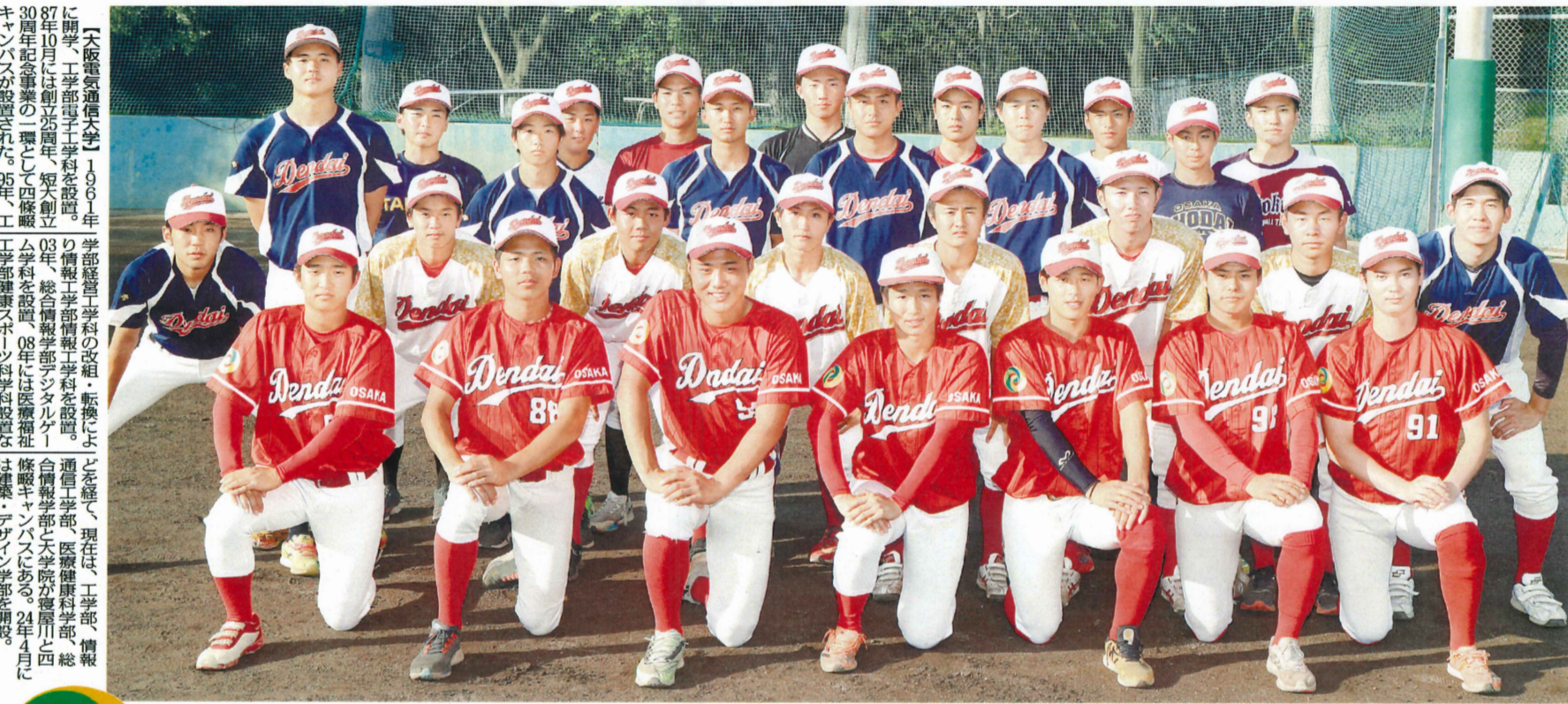
創部初の1部優勝を目指す大阪電通大硬式野球部

▽大阪電気通信大学硬式野球部 入れ替え戦で創部以来初の1部昇格を果たした。今年、強化指定選手として認められ、22年春季リーグ戦後のが投手コーチに就任している。