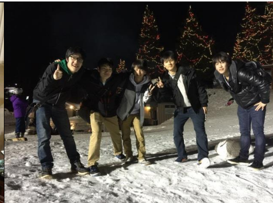
グラウスマウンテンスキー場にて