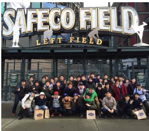
セーフコフィールドにて集合写真