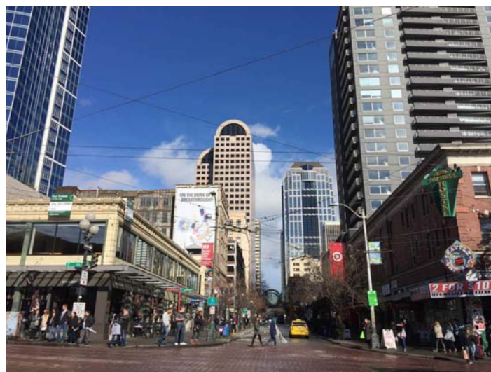
シアトルの旧市街の町並み①