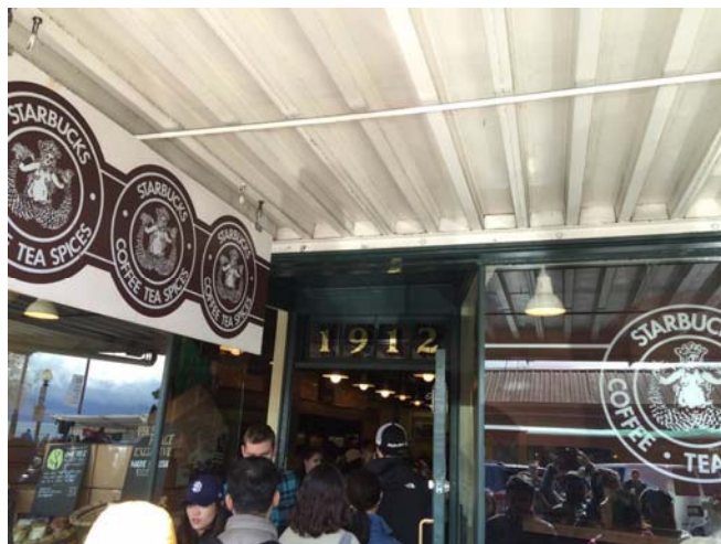
スターバックス1号店