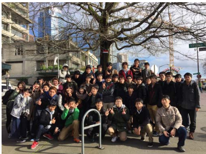
シアトルツアー集合写真