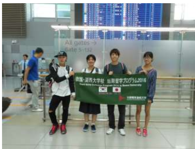
写真：仁川空港で最後の記念撮影