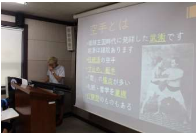
写真：私以外の学生さんの発表の様子です。みんな緊張しています。