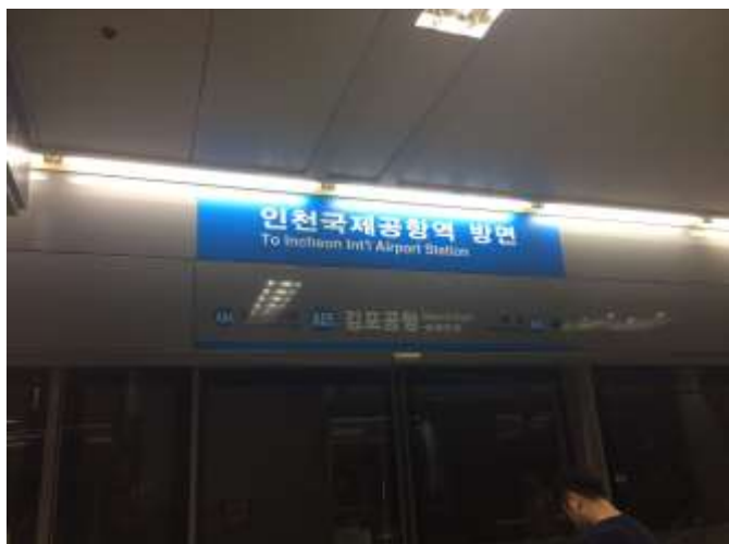
写真：仁川空港行きの乗り場

さて、荷物を持って仁川空港まで行くのですが、まずタクシーを拾って金浦空港まで行きました。おばあさんの家がソウル市内にある為、金浦空港までは近いのでそこから電車で仁川空港まで行くことにしました。ホームステイが始まってから 2 日間で電車には慣れたので、自分たちで切符を買って仁川空港まで行きました。