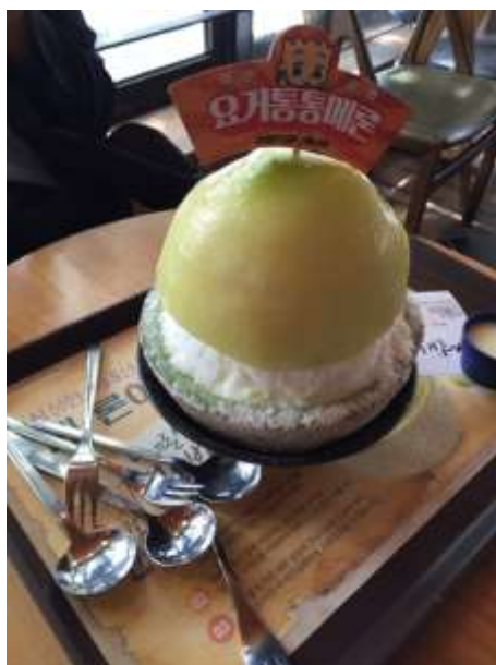
写真：メロン丸ごとのデザート

デザートはメロンを丸々一つ使ったもので中にアイス、生クリーム、餅が入っていました。珍しくとても美味しかったです。